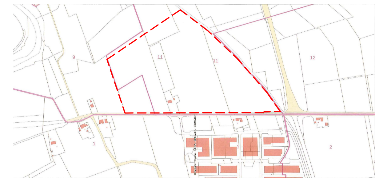
INQUADRAMENTO ZONA INTERVENTO Scala 1:10000

scala: 1:1000 1:5000 PONSACCO data ottobre 2023